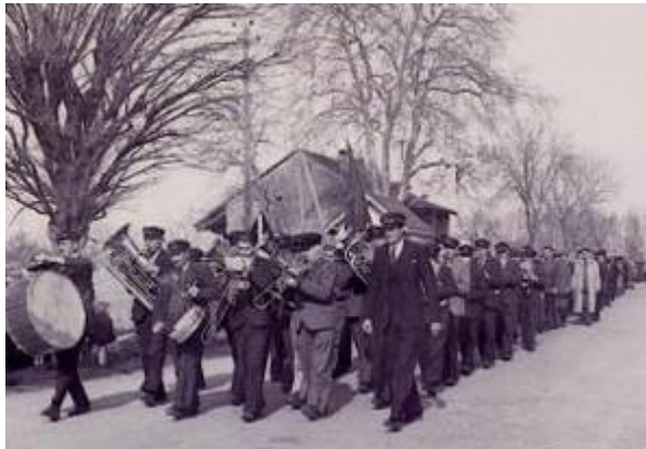
Inauguration de la reconstruction de l'École

Inauguration du Monument aux morts de Sciez